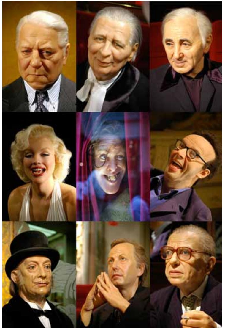
Paris, France, 2008