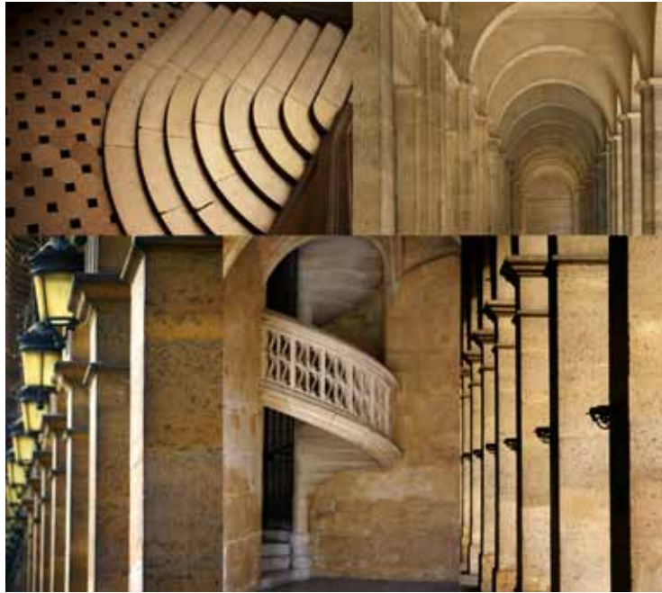
Paris, France, 2008