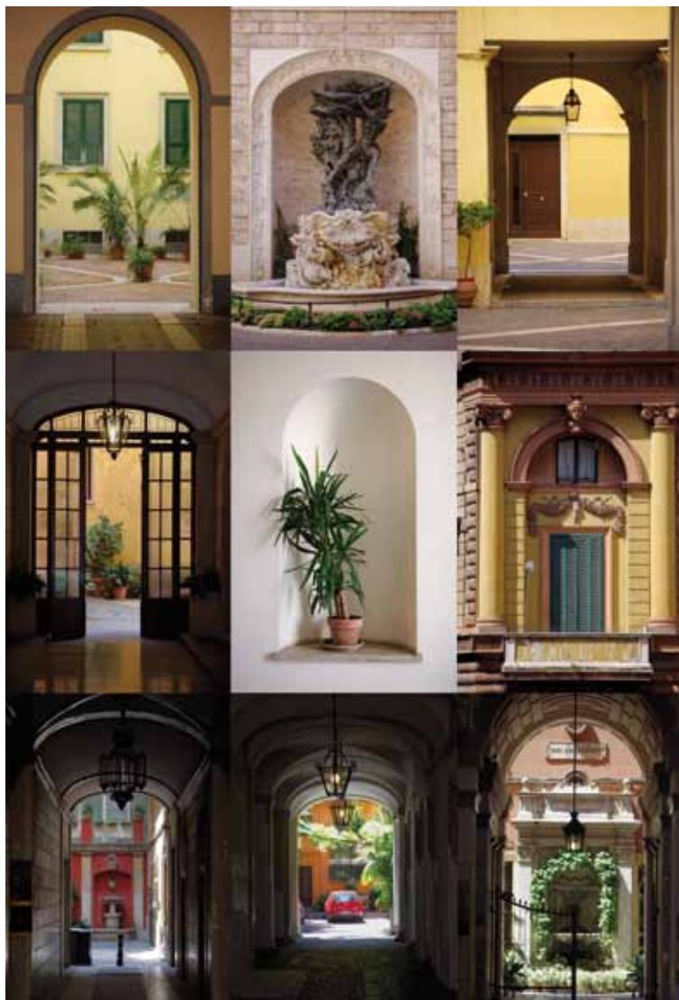
Rome, Italie, 2009