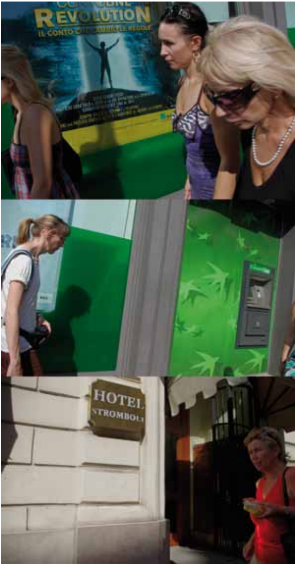
Rome, Italie, 2009